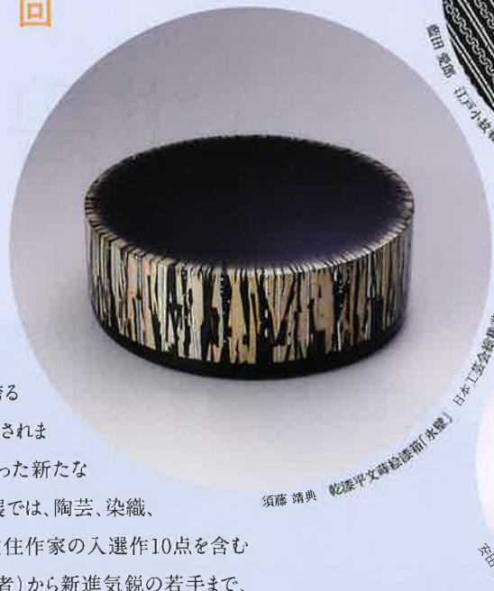
須藤 靖典 乾漆平文書絵巻筒「水鏡」 日本工芸会総裁賞

In 1954 this annual exhibition "Japan Traditional Kōgei - Art Crafts - Exhibition" was established for the development and inheritance of Japanese art crafts traditions. The aim of this exhibition has long been helping to develop new techniques and expressions relevant to modern life, based on traditional technique. We are exhibiting about 280 pieces, including 10 pieces created by artists from Hiroshima. There are 7 categories: ceramics; textiles; urushi (lacquer) work; metalwork; woodwork and bamboo work; dolls and others. Please enjoy the latest work of a broad spectrum of craftspeople from Living National Treasures (Holders of Important Intangible Cultural Property) to young and energetic artists who represent the Japanese art crafts world.