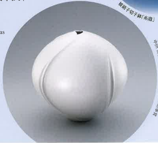
中田 博士 貝母光彫漆 東京都知事賞