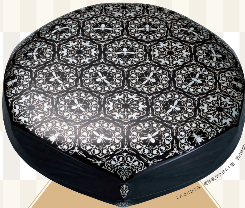
しんたにひとみ 乾漆銀平文はちす箱 朝日新聞社賞