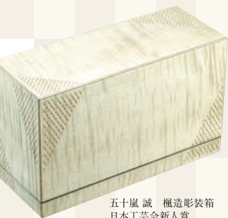
五十嵐 誠 楓造彫装箱 日本工芸会新人賞