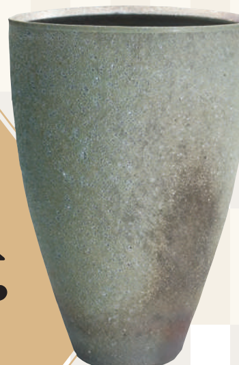
羽石 修二 窯変筒花器 日本工芸会会長賞