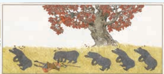
「旅人とクマ」 『きつねがひろった インソップものがたり1』 より 1987年