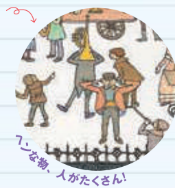
「7」な物、人がたくさん!