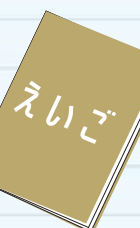
「ふしぎなり」 「はじめてであう ずうがくの絵本1」より 1982年