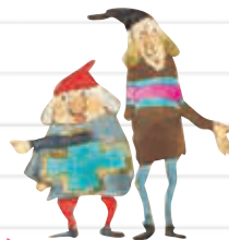
「まよいみち」 「はじめてであう ずうがくの絵本3」より 1982年