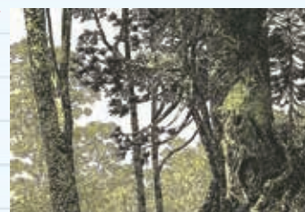
「もりのえほん」より 1977年