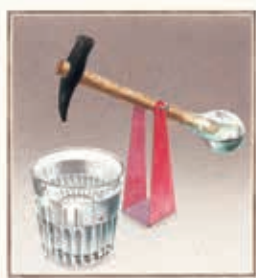
「水飲み鳥」 『空想工房の絵本』より 2014年