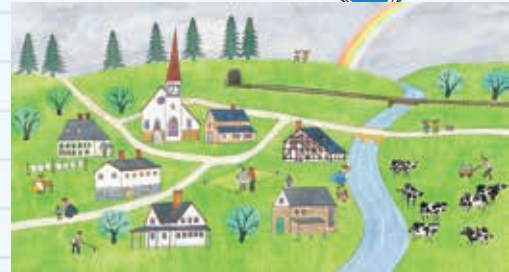
「7」「かぞえてみよう」より 1975年