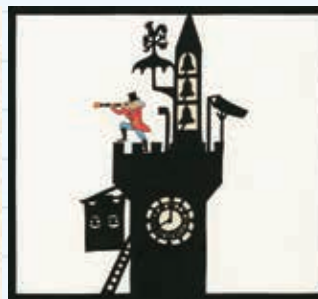
「かげぼうし」より 1976年