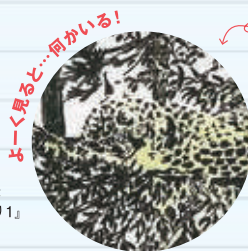
「よく見ると...何かいる!」