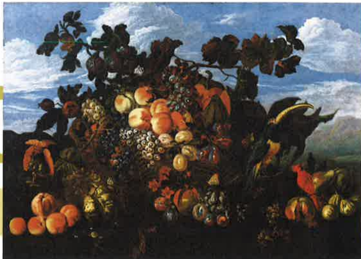
アブラハム・ブリューゲル 《果物の静物がある風景》 1670年 Private Collection