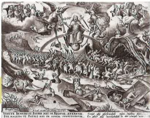
父 ピーテル・ブリューゲル1世 (1525/30~1569)