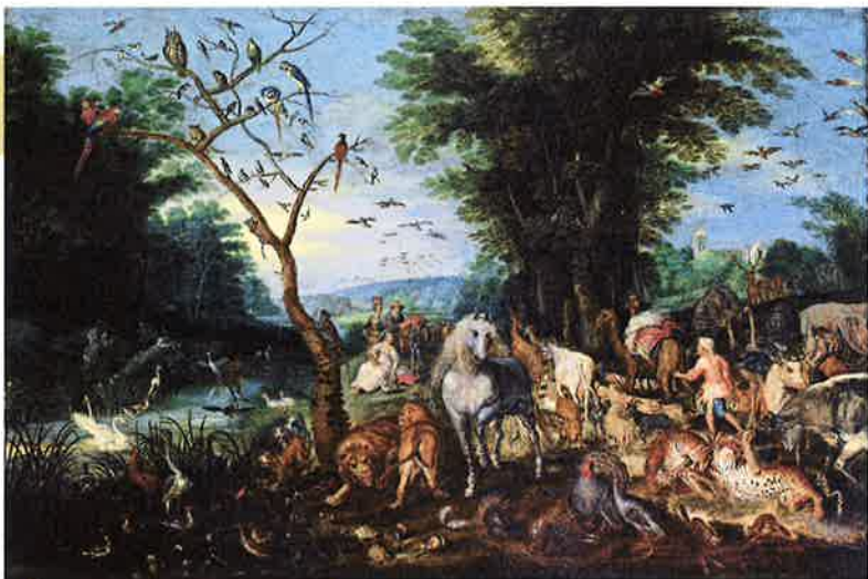
ヤン・ブリューゲル1世 《アアの街への美観》 1615年頃 Anhaltische Gemäldegalerie Dessau