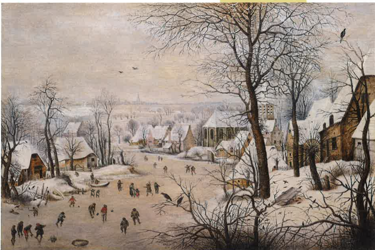
ピーテル・ブリューゲル2世 《雪景》 1601年 Private Collection, Luxembourg