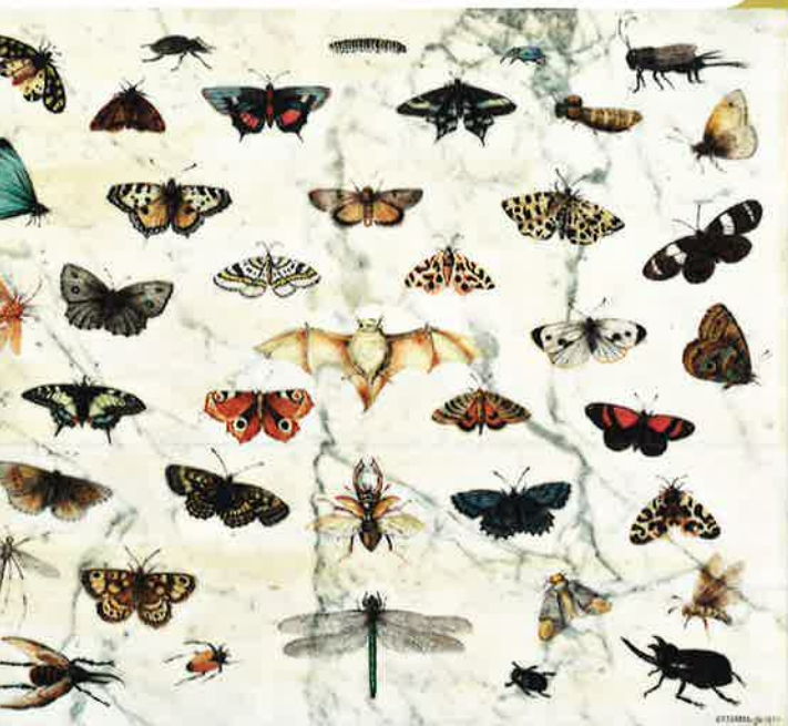
ヤンファンケッセル1世 《蝶、カブトムシ、コウモリの習作》 1659年 Private Collection, USA