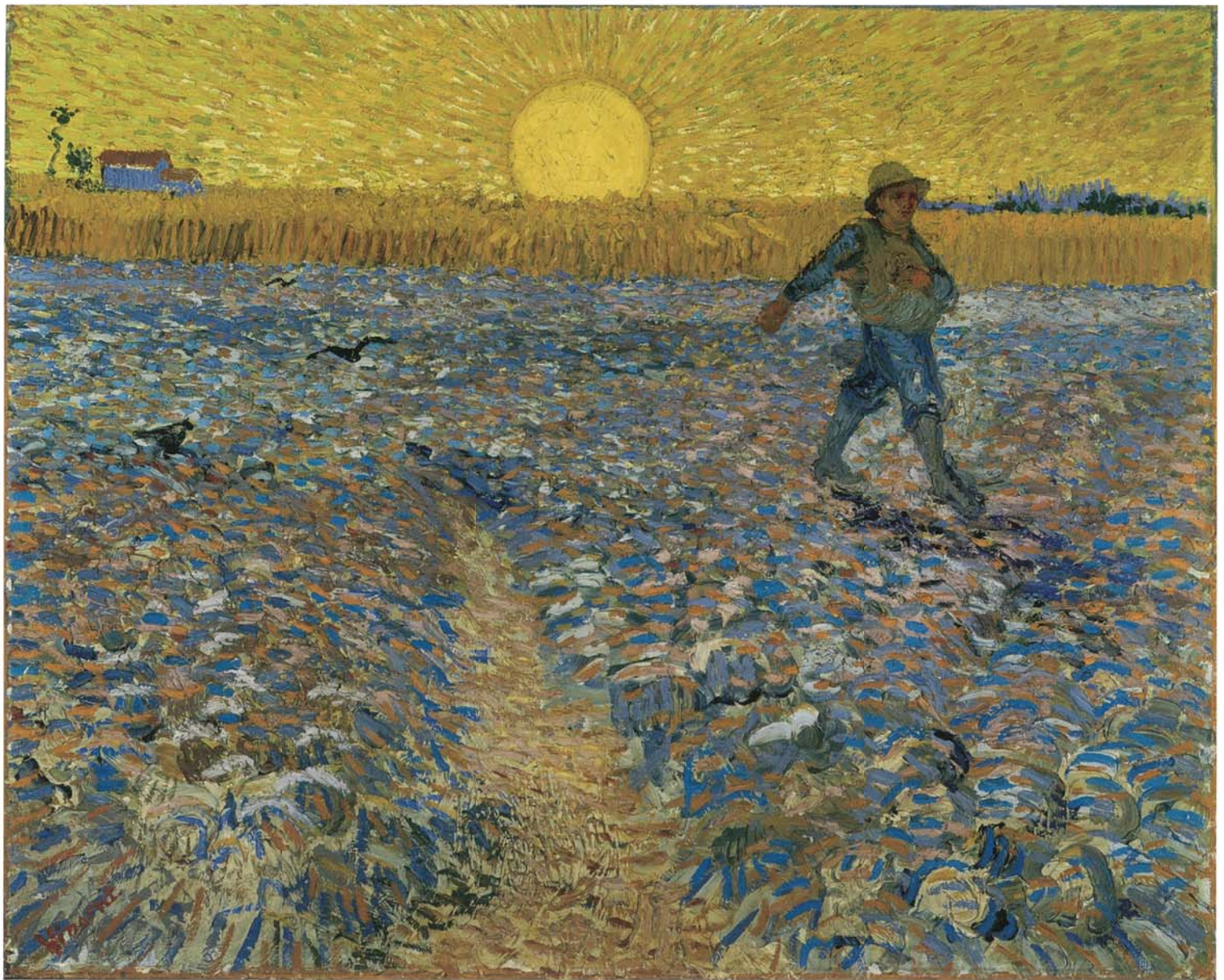
フィンセント・ファン・ゴッホ《種まく人》1888年 油彩・カンヴァス クレラー=ミュラー美術館蔵 ©Collection Kröller-Müller Museum, Otterlo, the Netherlands