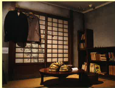
貧乏時代の居間再現コーナー