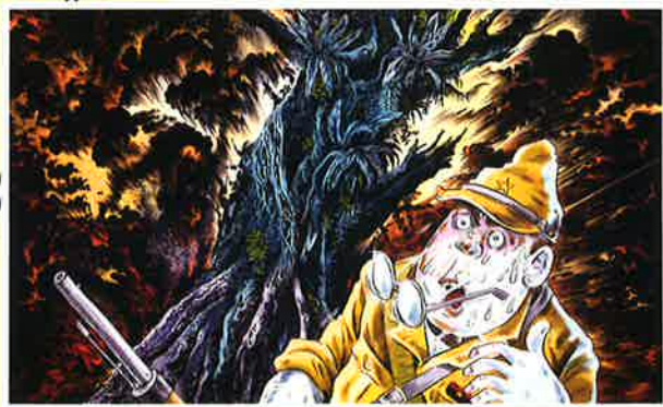
●ズンゲンで爆風を受ける 1988年

1943年(昭和18年)、水木しげるは太平洋戦争に召集され、パプア・ニューギニアの激戦地に送られます。出征前の苦悩が読み取れる手記原稿、戦地に持参した英和辞典、終戦直後の南洋で現地人や自然を描いたスケッチ、自身の戦争体験を重ねて描いた戦記漫画などを通じて、水木が経験した戦争の悲惨さを伝えるとともに、激戦地でも自然や現地人との触れ合いを大切にしていた水木の生き方にも触れます。