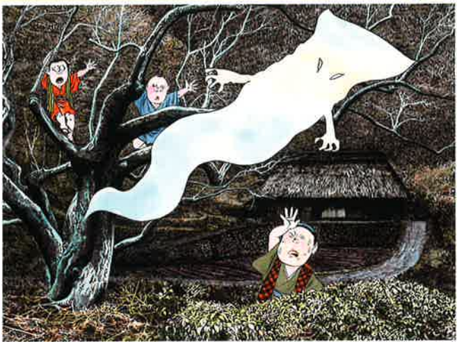
●一反木綿 1991年【展示期間:7月13日(土)~8月5日(月)】