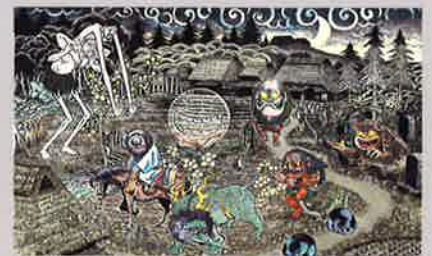
《妖怪のとき・暗闇の世界》