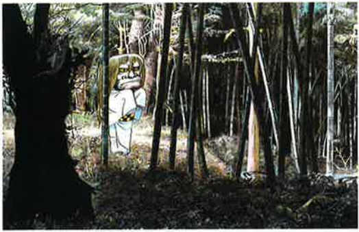
●砂かけ婆 1984年【展示期間:8月6日(火)~8月25日(日)】