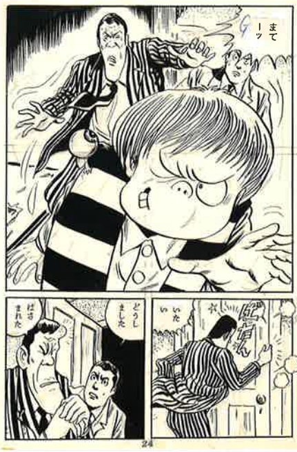
●墓場鬼太郎 怪奇一番勝負 1962年

九死に一生を得て復員した水木しげるは、片腕を失ったものの、絵描きへの情熱の炎を絶やすことはありませんでした。境港から神戸、東京へ居を移し、紙芝居作家から貸本漫画家となりますが、原稿料はごくわずか。食うや食わずの生活からはなかなか抜け出せませんでした。戦後に描いたどこか空虚さを感じるスケッチや、後の「ゲゲゲの鬼太郎」の原作となった貸本漫画「墓場鬼太郎」など貧乏生活の中で必死に描いた数々の貸本漫画原稿を展示します。水木夫妻が新婚当初暮らしていた居間を再現したコーナーには、実際に夫婦で作ったブラモデルや当時使っていた背広なども展示します。