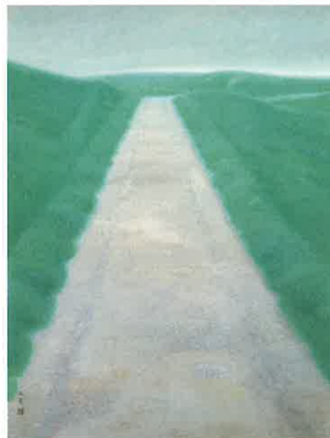
<道> 1950年 東京国立近代美術館蔵