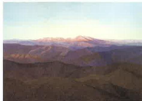
<残照> 1947年 東京国立近代美術館蔵

本展入館券のご提示により、一般・大学生・高校生は、100円で縮景園にご入園いただけます。