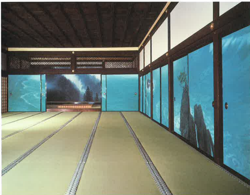
唐招提寺御影堂内部