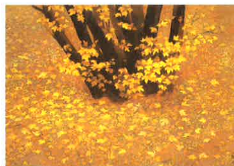
<行く秋> 1990年 長野県信濃美術館 東山魁夷館蔵