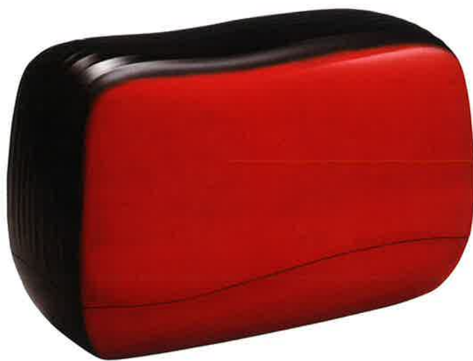
奥井美奈 乾漆箱「流れる」 日本工芸会総裁賞