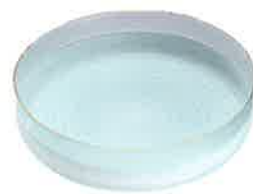
安達征良 硝子箱糸紋平鉢「一筆」 文部科学大臣賞