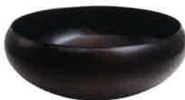
高月國光 樽造鉢 NHK会長賞