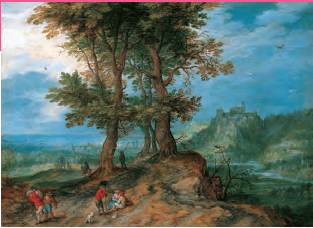
ヤン・ブリューゲル(父) 《市場への道》 1604年