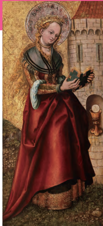
ルーカス・クラナーハ(父) 《聖バルバラ》 1520年以降

中国・景德鎮窯、金属装飾： イグナーツ・ヨーゼフ・ヴェルト 《青磁金具付大壺》 磁器：清王朝(1644-1912年)、 金属装飾：1760-70年頃