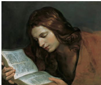
グイド・レニー 《読書する福音書記者聖ヨハネ》 1640年頃

ウィーン窯、帝国磁器製作所ゾルゲントール時代、 フェルディナント・エーベンバルガー 《金地薔薇文カップと受皿》 1798年頃