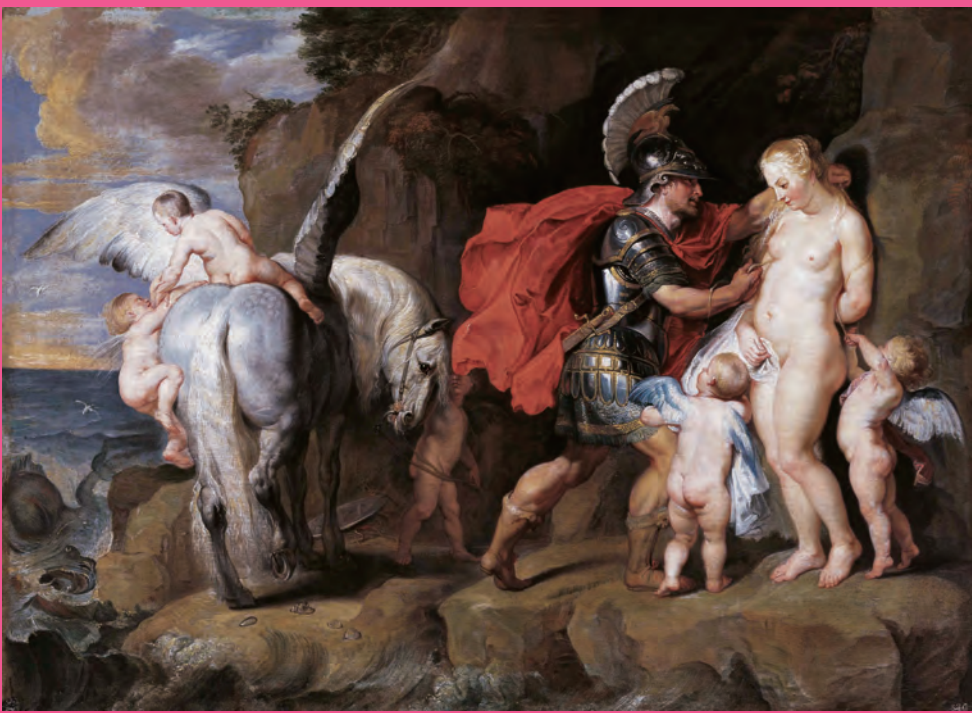
ペテル・パウル・ルーベンスと工房 《ベルセウスとアンドロメダ》 1622年以降