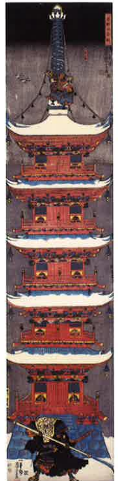
1. 歌川国芳《相馬の古内裏》弘化2~3年(1845~46)頃 高木繁コレクション / 2. 歌川国芳《信州川中野百勇将戦之内 真田喜兵衛昌幸》天保14~弘化3年(1843~46) 高木繁コレクション / 3. 月岡芳年《英名二十八衆句 団七九郎兵衛》慶応2年(1866) 尾崎久弥コレクション / 4. 歌川芳艶《為朝督十傑 白鐘姫 崇徳院》安政5年(1858) 尾崎久弥コレクション / 5. 歌川国芳《吉野山合戦》嘉永4年(1851)頃 高木繁コレクション / 6. 月岡芳年《見立多以尽とけけしたい》明治11年(1878) 尾崎久弥コレクション / 7. 歌川国芳《浮世し久志》弘化3~嘉永元年(1846~48) 高木繁コレクション ※すべて名古屋博物館蔵

旺盛な好奇心と柔軟な発想、豊かな表現力を武器に武者絵や戯画に新機軸を打ち出し、衰えつつあった幕末期の浮世絵に活況を取りもどした天才絵師・歌川国芳の作品を紹介するとともに、その弟子である月岡芳年や落合芳幾、歌川芳艶などの作品にもスポットを当て、幕末から明治にかけて社会情勢が激変するなか、国芳の個性がどのように世相を活写したのか、またその弟子たちは国芳の何を継承し、どのように変化していったのかを、約一五〇点の作品と資料によってご紹介します。