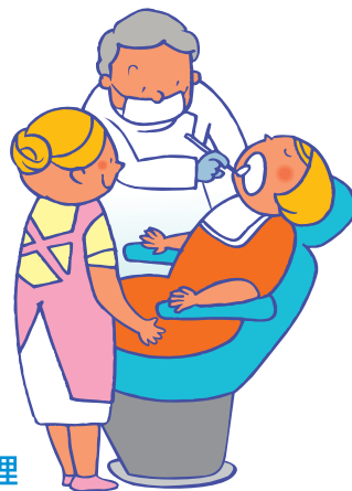
定期健診・保健指導・ 予防処置などの維持管理

あなたの現在と将来を見据えて、健康生活のためのアドバイスをします。 お口の健康で困っていることは、何でもお気軽にご相談ください。