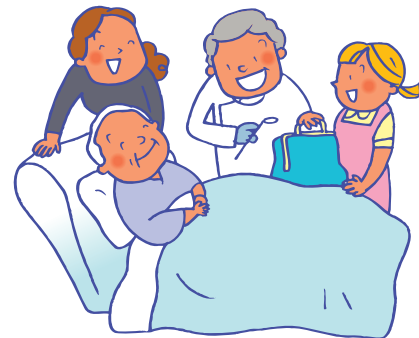
介護が必要な方への健診と治療